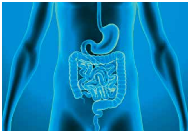
Der Magen-Darm-Trakt umfasst alle Organe, die an Nahrungsaufnahme und -transport sowie der Verdauung beteiligt sind.