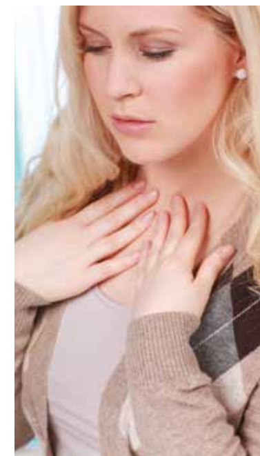
Die schmetterlingsförmige Schilddrüse produziert wichtige Hormone.